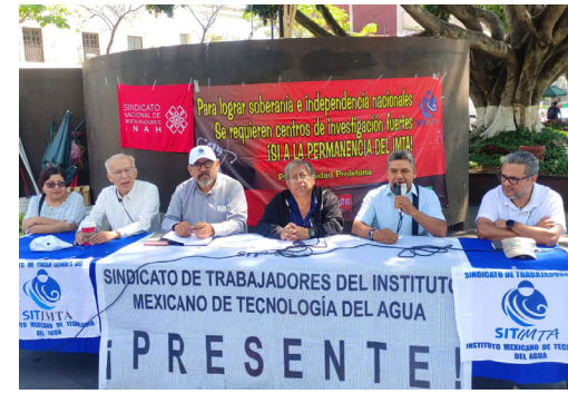
STAUACH presente en la conferencia de prensa del SITIMTA, en Cuernavaca, el 10 de abril.

El STAUACH estuvo presente el 10 de abril en la conferencia de prensa del SITIMTA y en la Reunión Extraordinaria de Representantes de la CNSUESIC en defensa de la permanencia del IMTA, en Jiutepec Morelos, donde se abordó el estado de la iniciativa de extinción del Instituto. El STAUACH se mantiene pendiente de su situación.