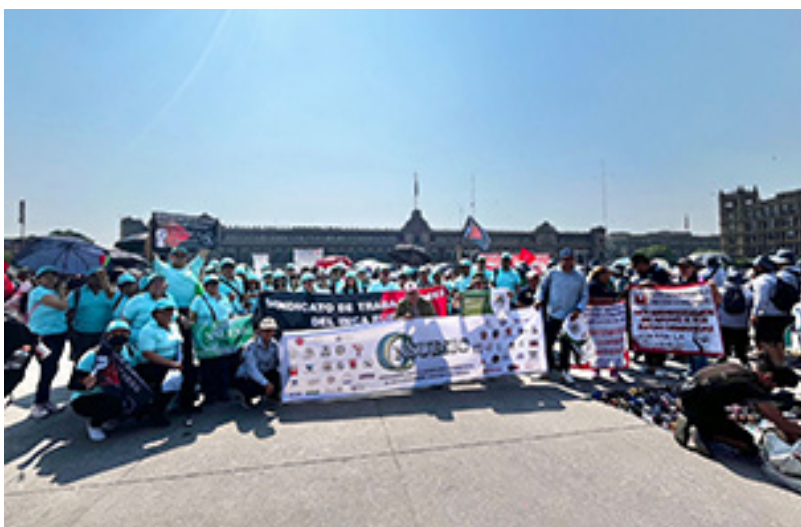
Concentración del contingente conformado por los sindicatos pertenecientes a la CNSUESIC frente al Palacio Nacional el 1º de mayo, Día Internacional de los Trabajadores.

Coordinación y participación en la marcha unitaria del 1º de mayo