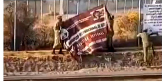
Imagen: el ejército retirando las lonas del SUTIN en protesta por un trato justo.

Demandamos se evite cualquier acción similar en contra de las organizaciones de trabajadores en lucha. Asimismo, solicitamos se tomen las medidas para que se atiendan las justas peticiones de los afiliados al SUTIN”.